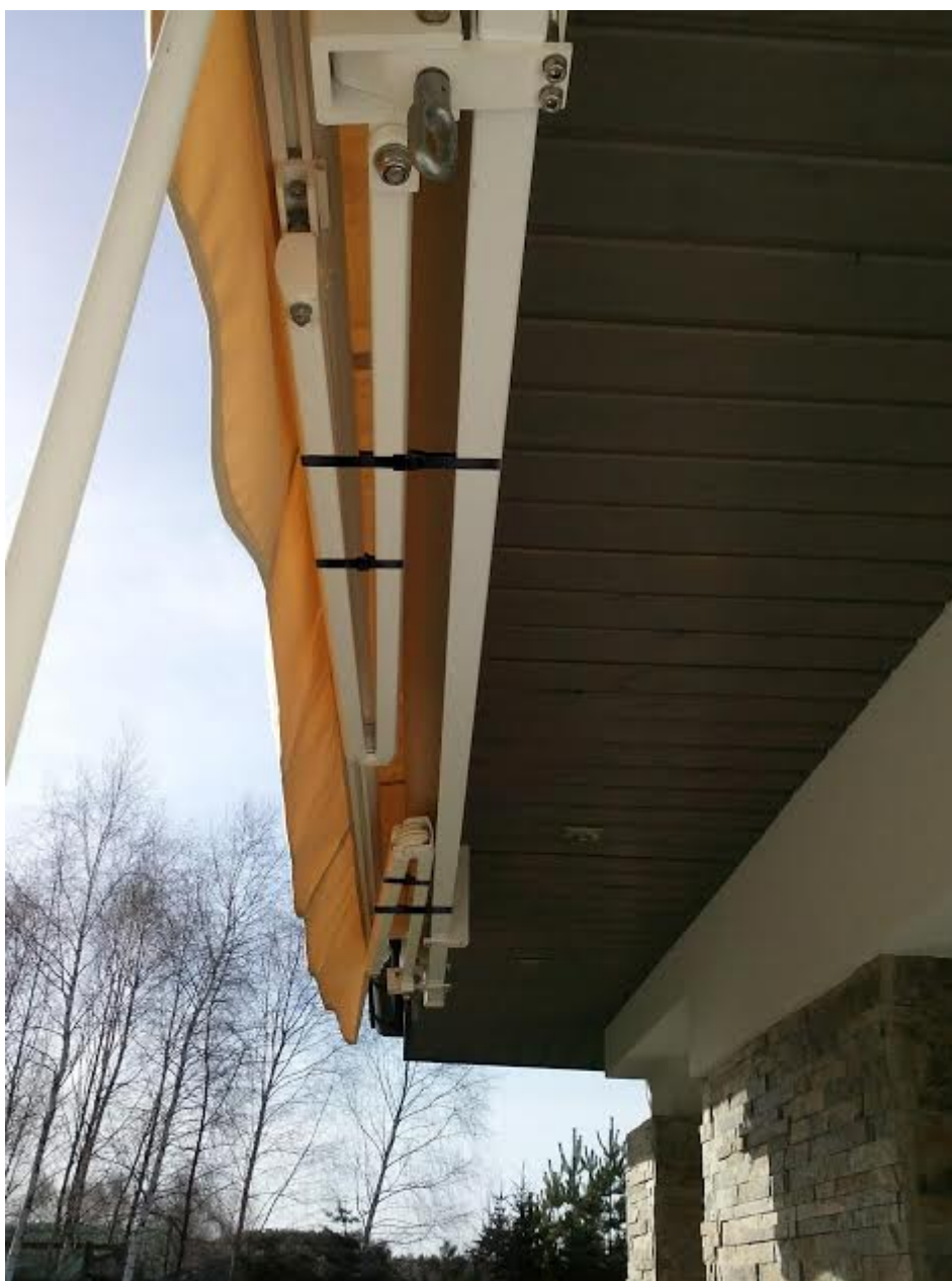
rys. 2 - zabezpieczenie ramion wysięgu przed wymianą pokrycia