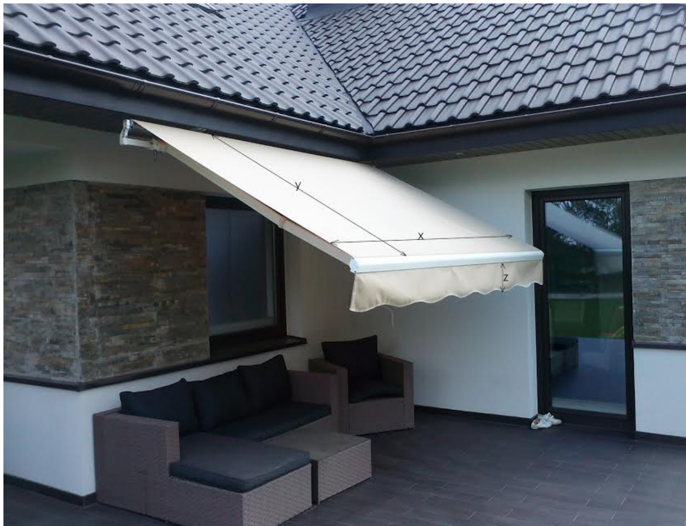
rys. 1 – wymiary pokrycia

Prosimy podać dokładnie: X- szerokość pokrycia markizy, Y - długość pokrycia od krawędzi mocowania, rodzaj falbany (prosta czy fala ) i jej długość Z ( w cm)